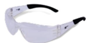
CÓDIGO: 10111011 SPIDER FLEX CL AF TIP NEGRO