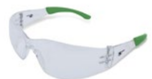
CÓDIGO: 10111020 SPIDER FLEX CL AF TIP VERDE