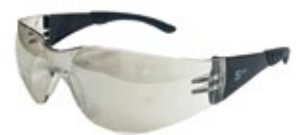
CÓDIGO: 10111012 SPIDER FLEX IN/OUT