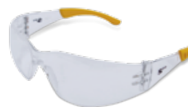
CÓDIGO: 10111016 SPIDER FLEX CL AF TIP AMARILLO