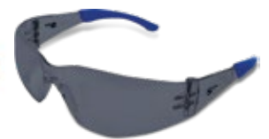
CÓDIGO: 10111015 SPIDER FLEX GY AF TIP AZUL