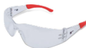
CÓDIGO: 10111018 SPIDER FLEX CL AF TIP ROJO