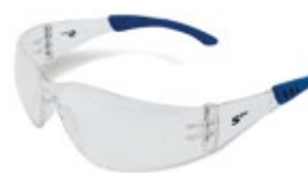
CÓDIGO: 10111014 SPIDER FLEX CL AF TIP AZUL